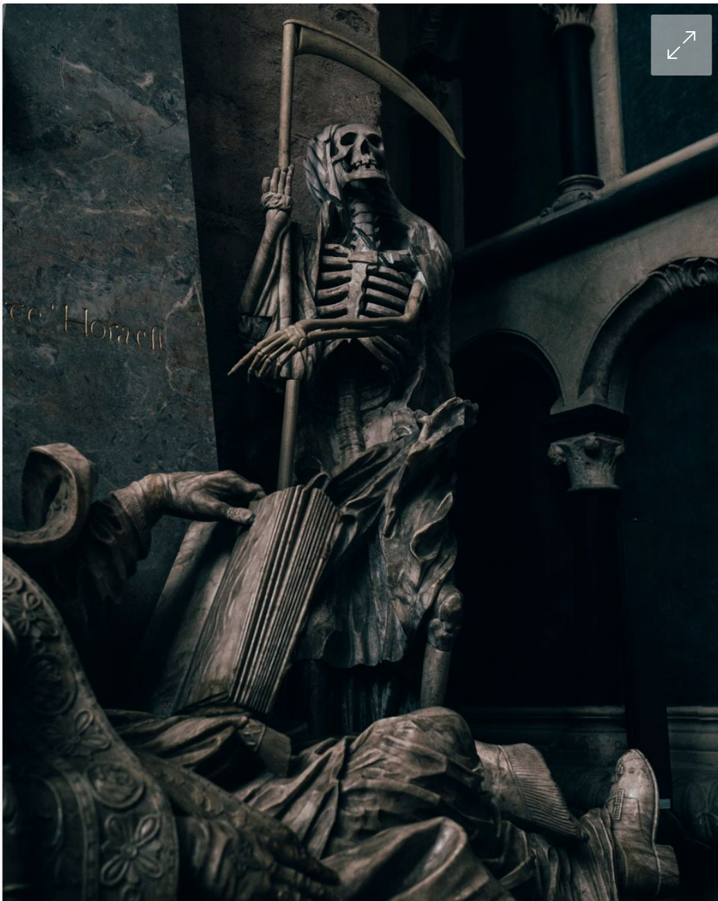
Innenaufnahme aus der Trierer Dom

In einem Städtchen soll ein Betreuer in einem katholischen Internat zu einem Jungen gesagt haben, er wolle mal nachschauen, ob er schon geschlechtsreif sei. Ein paar Kilometer weiter lebt ein Priester, eine Frau sagte aus, was sie mit ihm als Mädchen erfahren habe: »Er weist mich an, ihn am Bauch zu küssen, und hält meine Hand fest und masturbiert mit meiner Hand. Er sagt, er sei ein erfahrener Mann und dass es für mich bestimmt schön wäre, von ihm entjungfert zu werden.« Der Mann sagte später, er könne sich daran nicht erinnern.