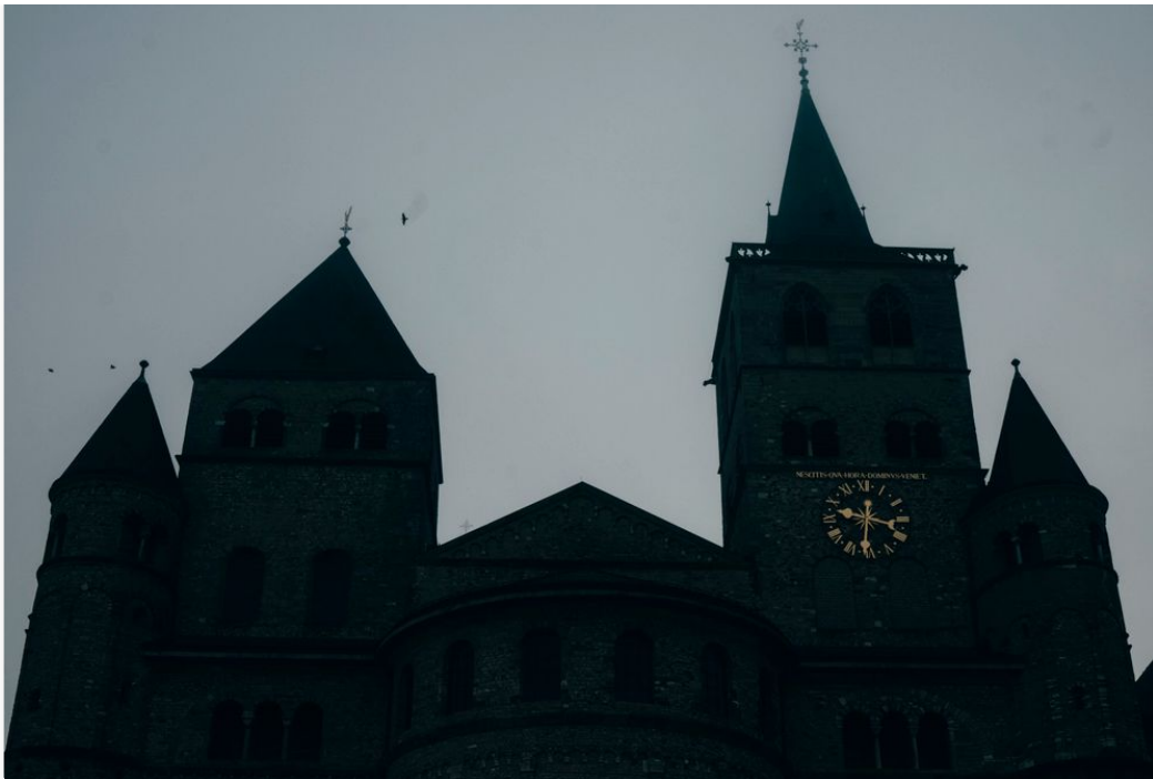
Der Trierer Dom

Karin Weißenfels ist kein Teil der MHG-Studie, sie war kein Kind, als es geschah, und es wurde vonseiten der Kirche nie vollständig wegen eines mutmaßlichen Sexualdelikts ermittelt.